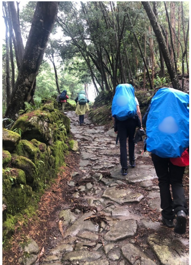
Pellegrini in cammino

Le citazioni e gli stralci nel testo sono tratti dalla Lettera di Papa Francesco “ SPES NON CONFUNDIT ”. Il Logo ufficiale del Giubileo 2025 deriva dal sito www.iubilaeum2025.va .